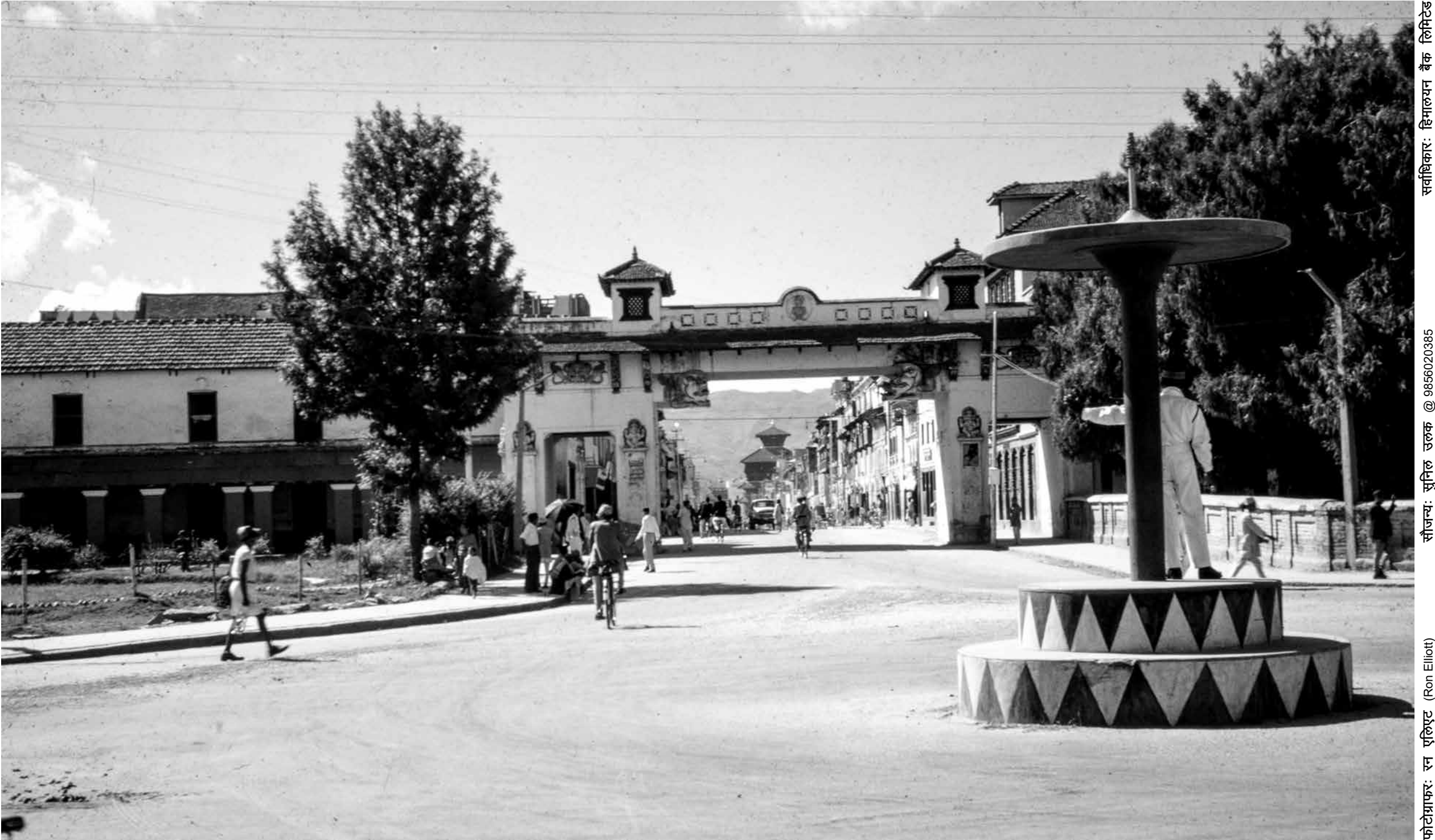
न्युरोड गेट, काठमाडौं (वि.सं. २०२०)