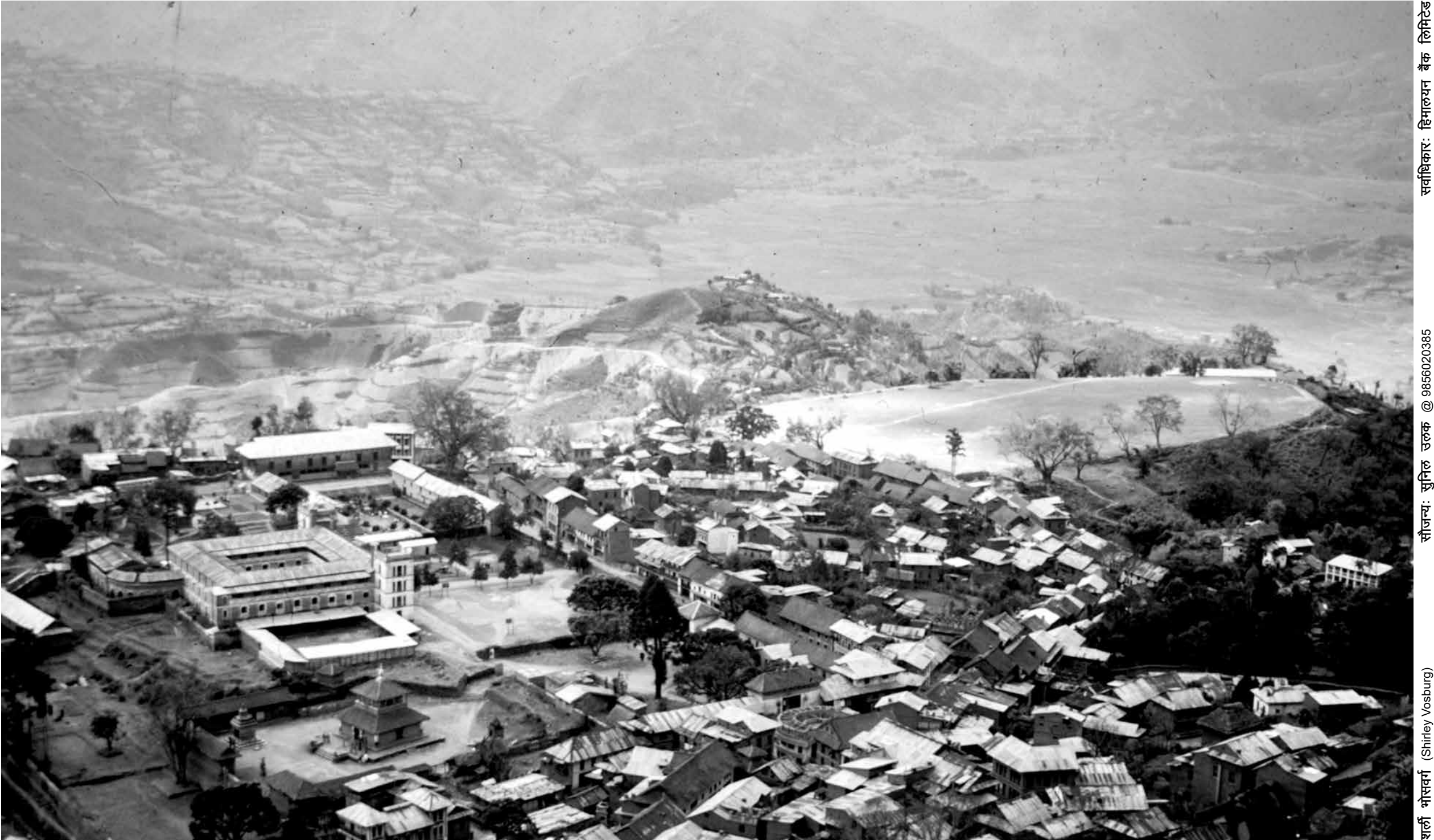
पाल्पा दरवार तथा टुँडिखेल, पाल्पा (वि.सं. २०२५)