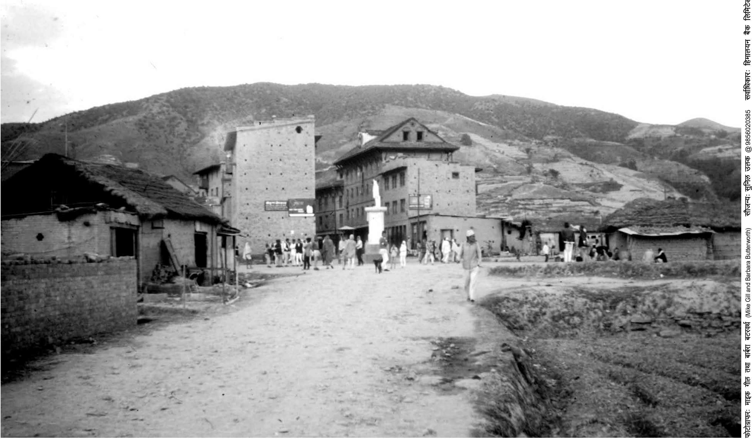
त्रिभुवन चोक, बनेपा, काभ्रेपलाञ्चोक (वि.सं. २०२४)