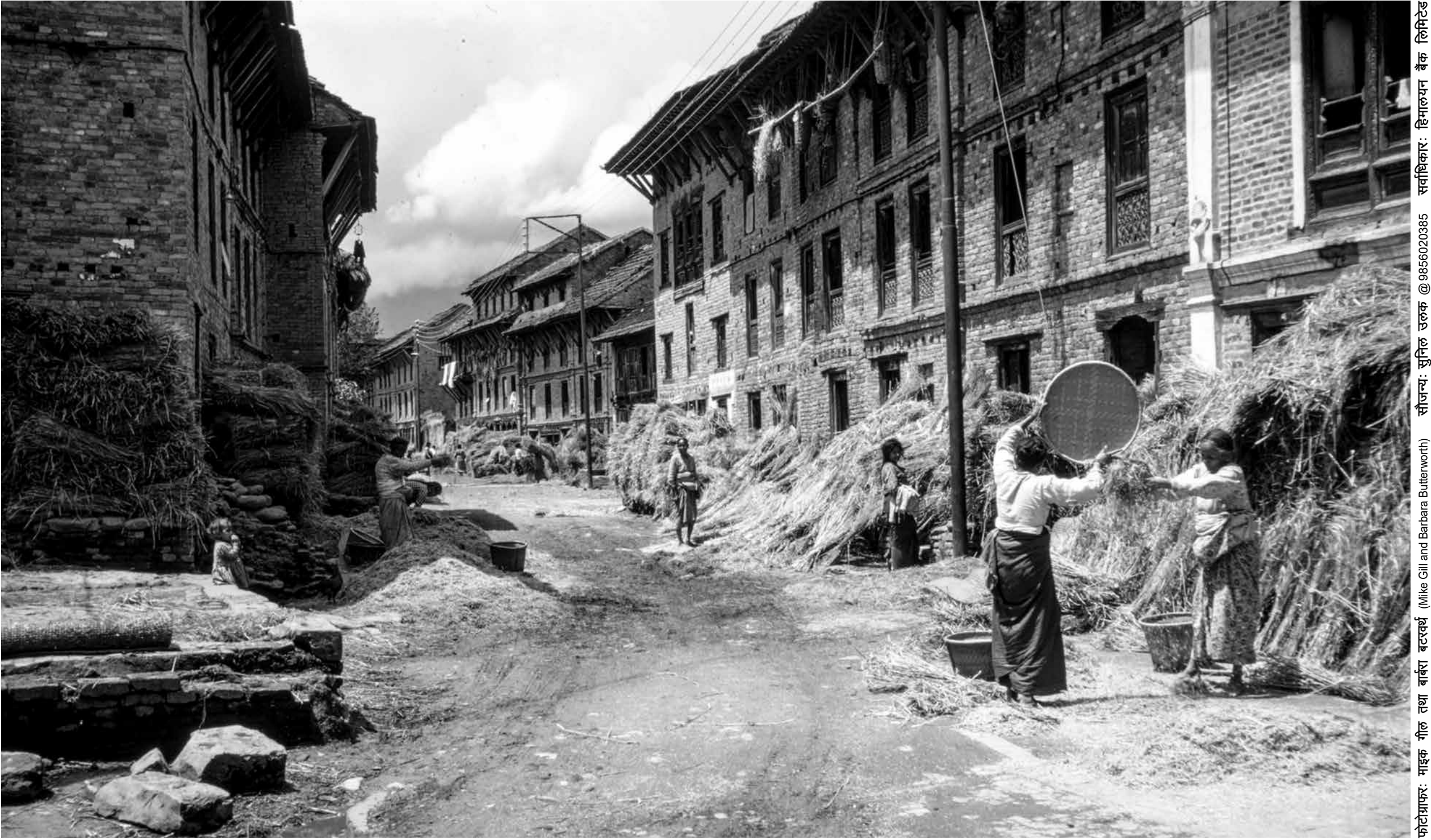
चापागाँउ, ललितपुर (वि.सं. २०२५)