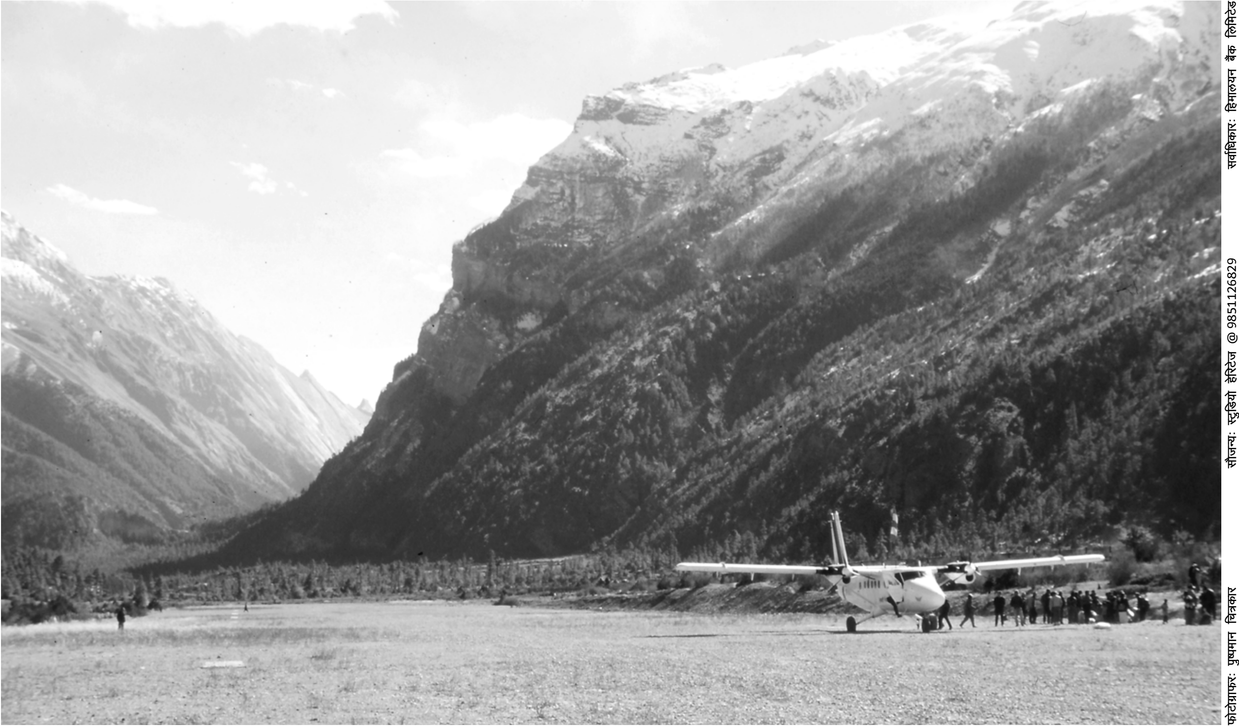
हुम्दे विमानस्थल, मनाङ्ग (वि.सं. २०४३)

सौजन्य: स्टुडियो हेरिटेज @ 9851126829 फोटोग्राफर: पुष्पमान विनकार सर्वाधिकार: हिमालयन बैंक लिमिटेड