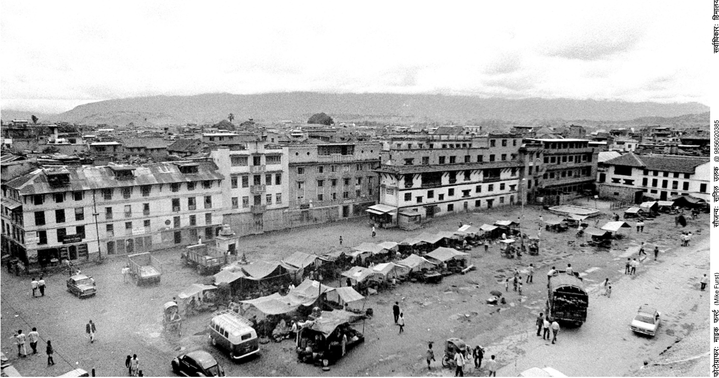
बसन्तपुर डबली, काठमाडौं (वि.सं. २०२७)