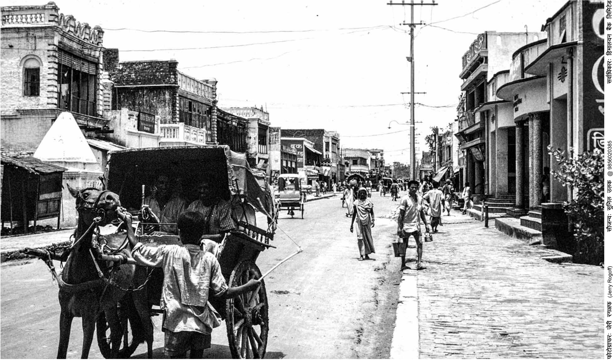
वीरगंज बजार, वीरगंज (वि.सं. २०२४)