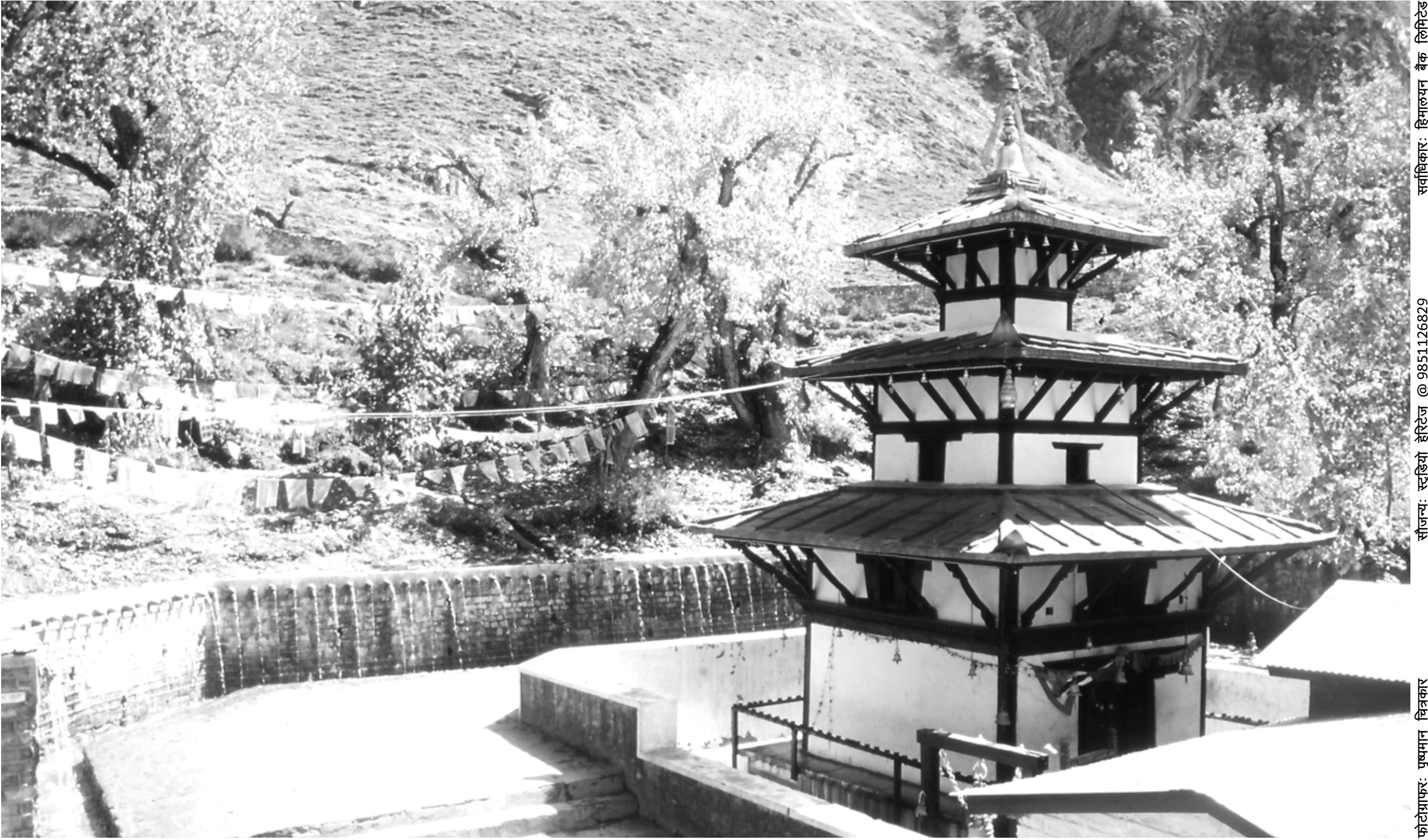
मुक्तिनाथ मन्दिर, मुस्ताङ्ग (वि.सं. २०४५)