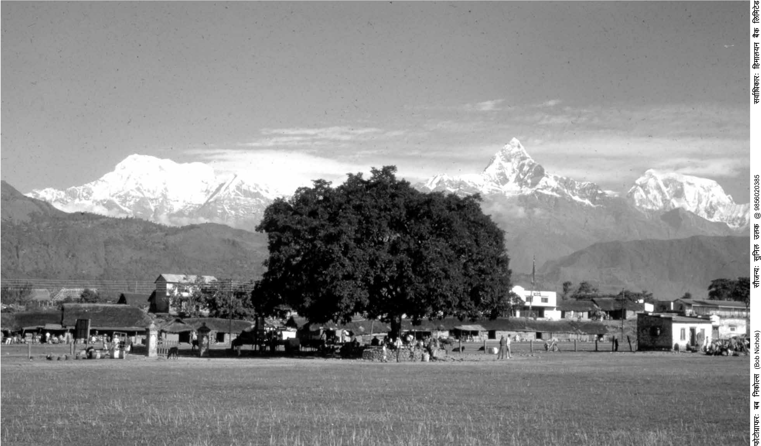
पोखरा विमानस्थल, पोखरा (वि.सं. २०२४)