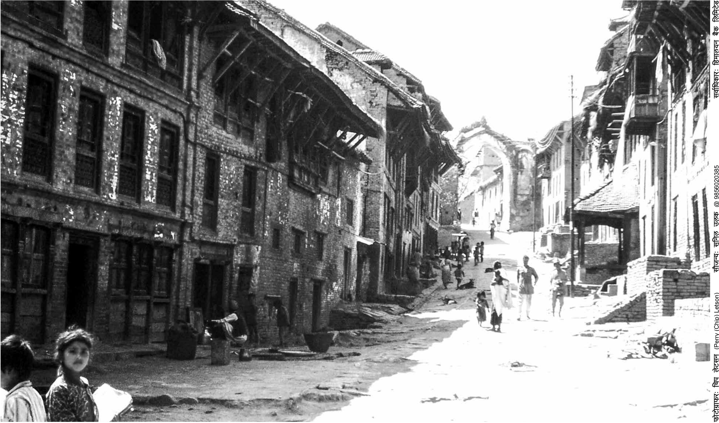
सिद्धपोखरी नजिकैको भक्तपुर ढोका, भक्तपुर (वि.सं. २०२८)